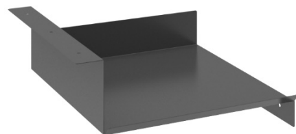
Tablette métallique (côté droit)