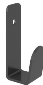
Crochet métal po vêtemen