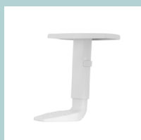
Accoudoirs en plastique blanc réglables en hauteur