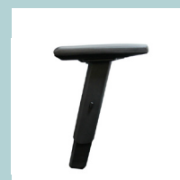
Accoudoirs réglables 2D avec coussinets en PU