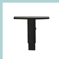
Accoudoirs en plastique noir réglables en hauteur