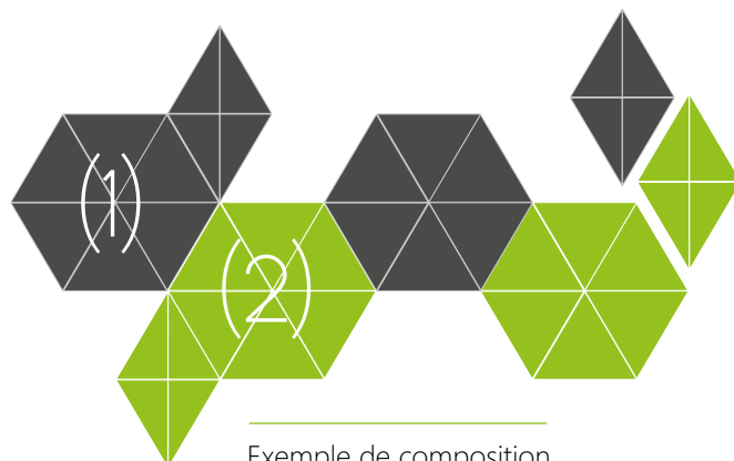
Exemple de composition QUIETOSTICK 2 kits UNI-color