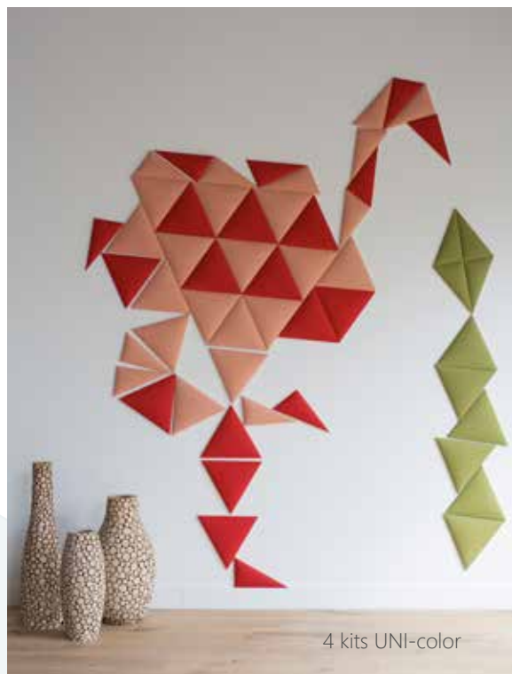
4 kits UNI-color