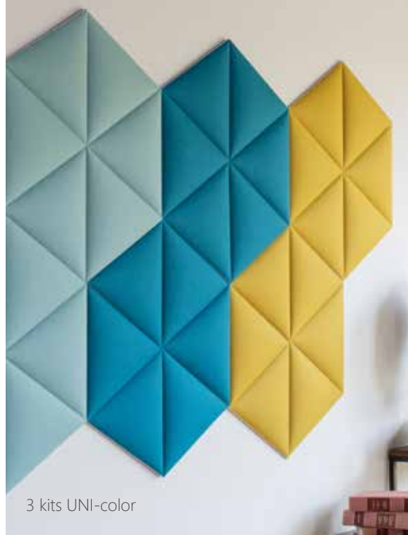
3 kits UNI-color