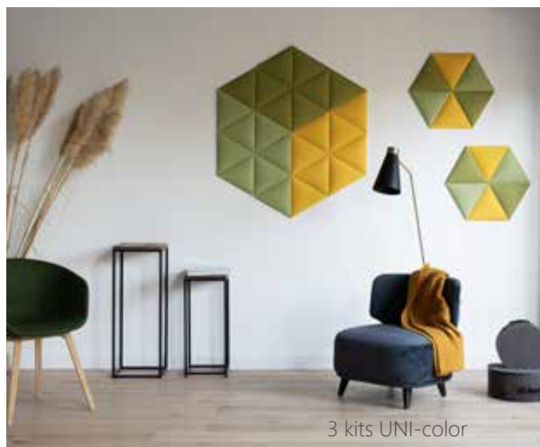
3 kits UNI-color

Le minimum de commande est constitué d'un d'un kit produit UNI-color* composé de :