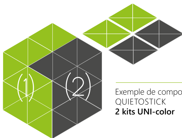
Exemple de composition QUIETOSTICK 2 kits UNI-color